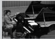
2014年、大阪音楽大学でのマスタークラスの様子

「現代の最も優れたベートーヴェン弾きの一人」と称されるレオッタ氏のベートーヴェンに対する深い理解と完璧な技術に触れる貴重な機会。公演と合わせて是非ご参加ください。